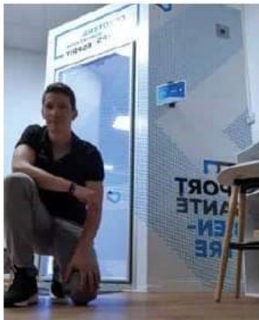
▲ La cabine permet de refroidir tout le corps.

Le pôle de cryothérapie de Limoges propose différents types de prestations : un traitement local par un jet d'air pulsé refroidi à -150^{\circ}\text{C} et une cabine permettant l'immersion complète dans un froid sec. Réalisés avec du matériel médical aux normes CE, les traitements localisés permettent de lutter contre les troubles musculosquelettiques, les entorses, les tendinites, mais ont aussi des vertus esthétiques (réduction des pores de la peau, raffermissement du visage qui procure un effet bonne mine immédiat).