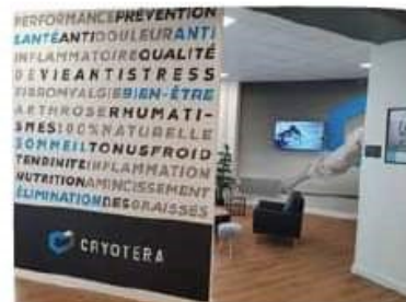
▲ Le pôle de cryothérapie de Limoges propose plusieurs types de prestations.

Deux récentes publications scientifiques confortent les bienfaits de la cryothérapie dans le traitement médical de certaines maladies comme la polyarthrite rhumatoïde. « Les médecins ont constaté la diminution des douleurs chroniques et inflammatoires avec un protocole de séances répétées de cryothérapie, qui se traduit par une importante baisse de raideur des membres et facilite grandement la sollicitation quotidienne des articulations des mains notamment. Les études menées dans le service ORL du CHU de Reims ont également prouvé l'efficacité de la cryothérapie pour soigner les pertes d'odorat engendrées par le virus de