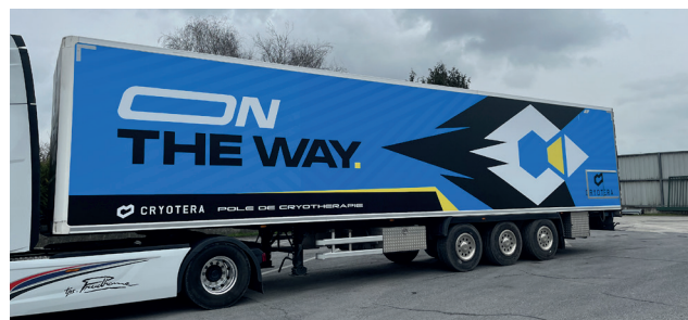
Le camion est 100 % aménagé.

Il s'agit fréquemment de douleurs musculaires, de tendinites (inflammations d'un ou plusieurs tendons ou gaines tendineuses) ou de syndromes canaux (compressions d'un nerf ou racine nerveuse dans un passage anatomique). Les lombalgies (douleurs au niveau du bas du dos), les cervicalgies (douleurs au niveau du cou), le syndrome du canal carpien au poignet, le syndrome de la coiffe des rotateurs à l'épaule, l'épicondylite latérale au coude font partie des TMS les plus fréquents. Moins fréquents, les TMS des membres inférieurs surviennent également comme l'hygroma du genou.